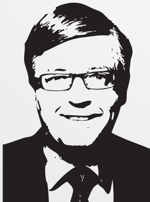
Hans-Peter Bartels Wehrbeauftragter des Deutschen Bundestags

” Der Deutsche Bundeswehrverband ist ein Teil gelebter Demokratie in der Bundeswehr. Dass Soldatinnen und Soldaten eine eigene Gewerkschaft haben, versteht sich nicht von selbst. Viele soziale Errungenschaften, die unsere Streitkräfte heute auszeichnen, sind auf das Engagement von Vertrauensleuten, Personalräten und deren Rückgrat, den Bundeswehrverband, zurückzuführen. Der Unterstützung des Wehrbeauftragten kann sich der Verband – wie in der Vergangenheit – auch künftig gewiss sein.