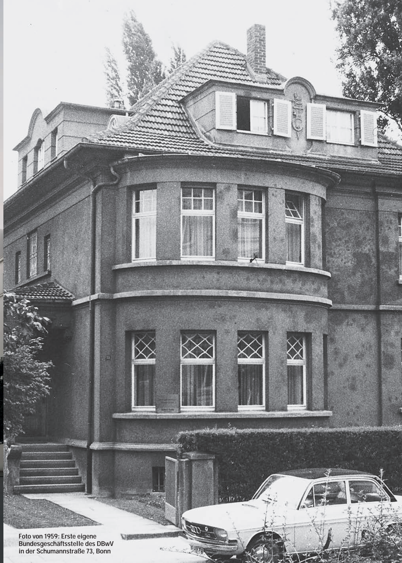
Foto von 1959: Erste eigene Bundesgeschäftsstelle des DBwV in der Schumannstraße 73, Bonn