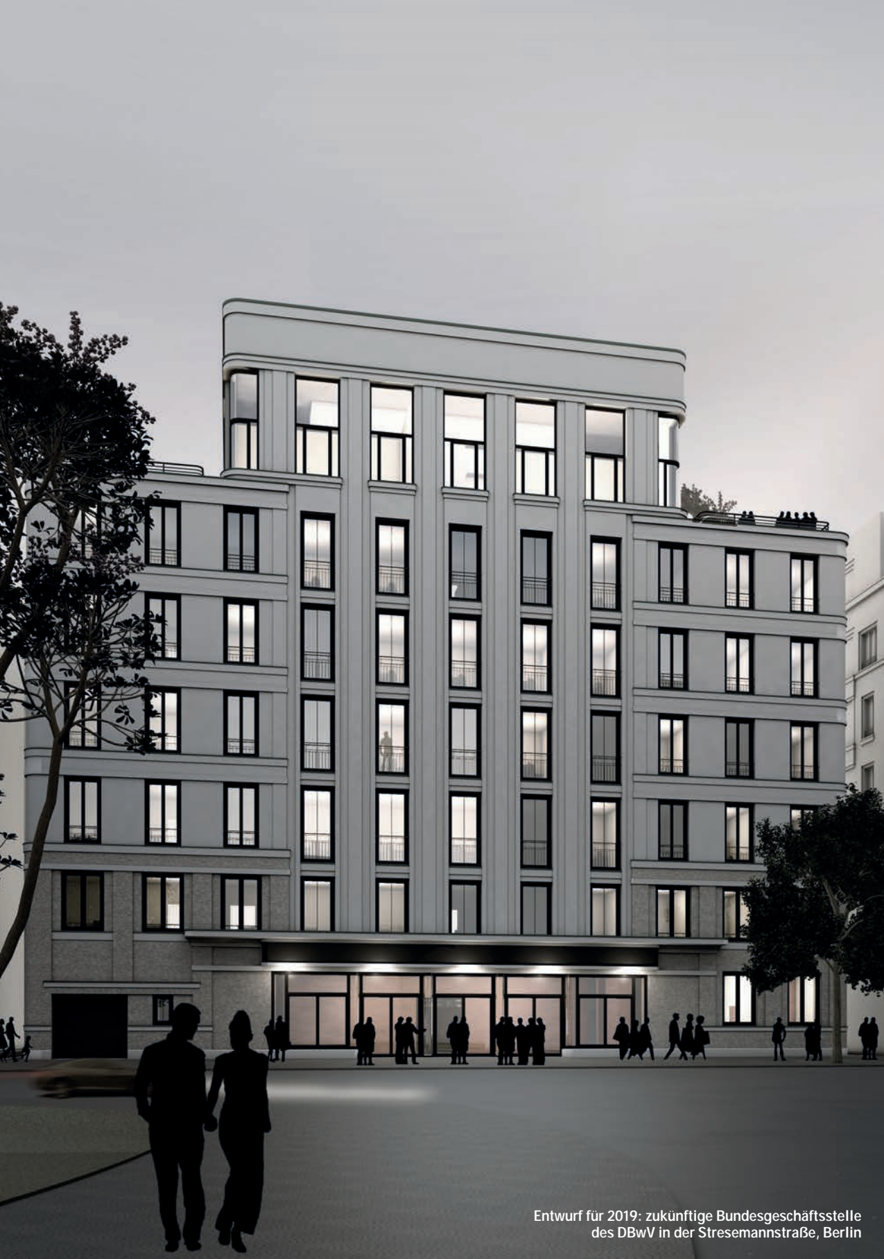
Entwurf für 2019: zukünftige Bundesgeschäftsstelle des DBwV in der Stresemannstraße, Berlin